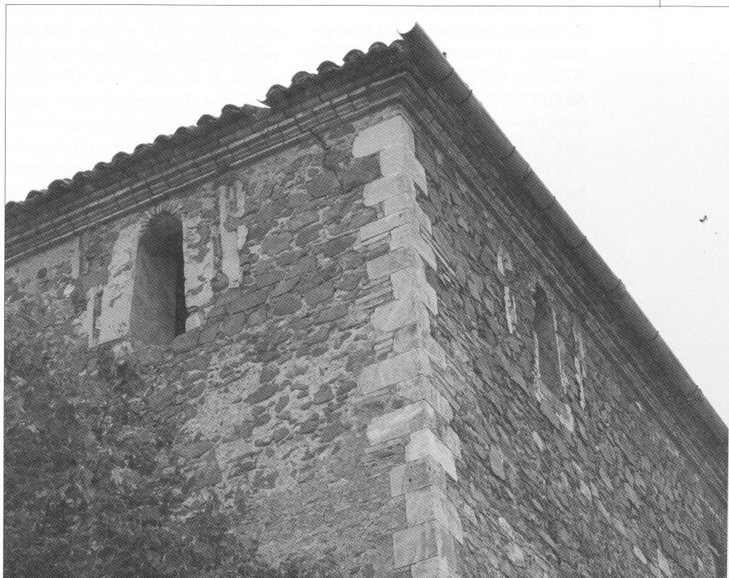
Restes de les antigues garites localitzades a les cantonades de les parets nord-est i nord-oest. Església de la Vilella Alta.

L'ESGLÉSIA, DURANT LES GUERRES CARLINES, EN SER L'EDIFICI MÉS ALT I ROBUST DEL POBLE PASSÀ A CONVERTIR-SE EN UN BASTIÓ MILITAR.