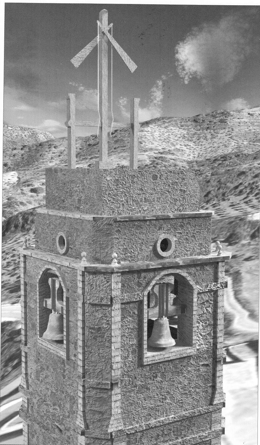
Reconstrucció virtual de la disposició del telègraf òptic Salamanca, al campanar de la Vilella Alta. Autor: Pere Manel Martín Serrano.

Durant la primera guerra Carlina, l'església de la Vilella Alta es convertí en fortí. El 1837, la