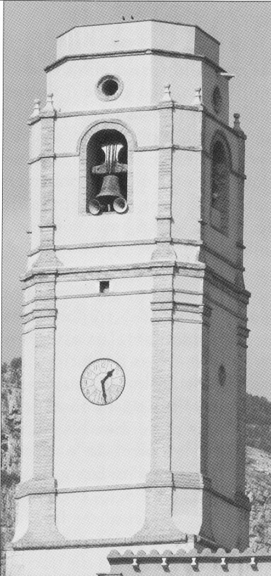
Campanar de la Vilella Alta, any 2014.

Diputació rebia de mans del consistori una sol·licitud per a la fortificació i la defensa del poble, atès que amb els portals no n'hi havia prou. El fet és que la Comandància de la Milícia Nacional s'establí a la vila. I això comportaria tot un seguit de queixes i denúncies creuades entre el consistori, la Diputació i el comandant de milícies.