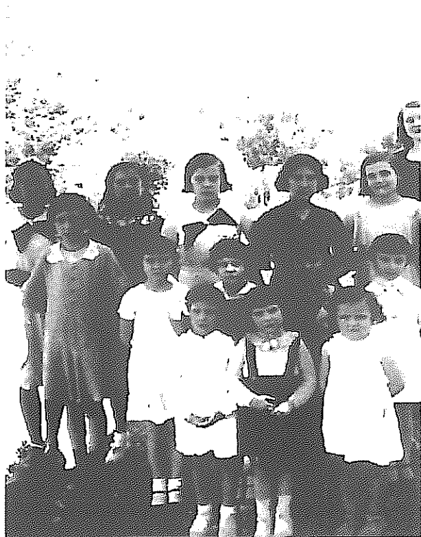
Nenes i noies de la Vilella Alta a principis dels anys 30.

Les dones de la Vilella recorden totes elles perfectament la ubicació dels soldats per les cases del poble: «Hi havien sapadors, transmissio-nistes, antitànecs... A les cases que eren buides o que vivia poca gent s'instal·laren els soldats... La convivència fou molt bona, mai vam tenir cap problema amb ells. A l'església feien cinema i podíem anar tots els del poble... Al Cafè van instal·lar l'Hospital de Sang, i si no estaves bé de salut et visitava el metge i et proporcionaven medicines.» Si bé les