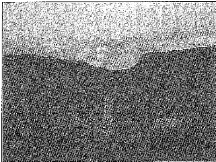
Vista panoràmica actual de la Vilella Alta

postes estatutàries del President Macià a l'hora de confeccionar l'Estatut de Núria, aportant idees tan modernes com el fet que el Servei Militar Obligatori passés a ser voluntari, i en cas de no poder ser-ho, que la instrucció es realitzés per un curt període de temps i sempre dins de territori català.